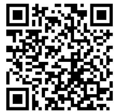
奈良県観光プロモーション課 公式アカウント

※必ず奈良県観光プロモーション課公式Instagramアカウント(@narakankopuromo)をフォローしてご応募ください。審査時にフォローを外されていると、審査の対象外となりますのでご注意ください。